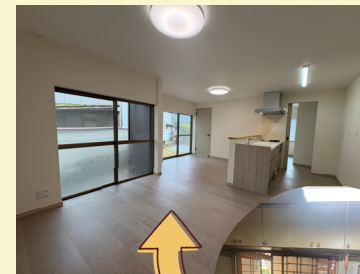
LDと居間の壁をなくして、広がり感のあるLDKになりました