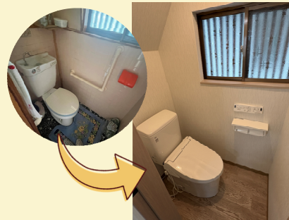
暖房洗浄便座にグレードアップ!

築古の木造住宅を全面リフォームして柱、梁の構造強度のチェックと補強を行ったものです。今回工事の特徴は内装、外装、住宅設備、電気、給排水設備、弱電設備、外構とも全てをフルに改造工事を行い、新築と変わらぬグレードに仕上げたものです。(無垢階段のみ既存)また個室には幅広い収納量を確保し、共用収納と合わせた大容量を確保しました。一度見学していただくことで、間取りの機能性や充実した最新設備機器を体感していただきたいです。駐車は普通車が楽々と2台分のスペースを確保しております。