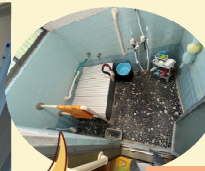
手作り浴室を、使い勝手と掃除のしやすいユニットバスに!