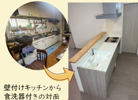
壁付けキッチンから食洗器付きの対面キッチンへ