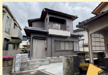
外観も、塗装をして新築同様!玄関ドアも新設しました!