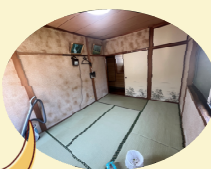
和室を洋室にして、押入もクローゼット仕様になりました!