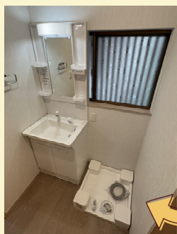
洗面脱衣室も一新! 洗面化粧台も洗濯パンも新品です!