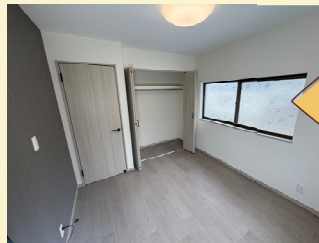
和室を洋室にして、押入もクローゼット仕様になりました!