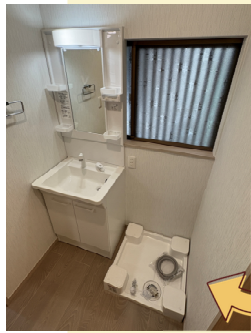
洗面脱衣室も一新! 洗面化粧台も洗濯パンも新品です!