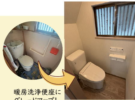
暖房洗浄便座にグレードアップ!

築古ではあるが、 全面リフォーム を期に柱、梁の構造強度の確認と補強を行ったものです。今回工事の特徴は内装、外装、住宅設備、電気、給排水設備、弱電設備、外構とも全てをフルに改造工事を行い、新築と変わらぬグレードに仕上げたものです。(無垢階段のみ既存)また個室には幅広い収納量を確保し、共用収納と合わせた大容量がありがたい。一度見学していただくことで、間取りの機能性や充実した最新設備機器を体感していただきたいです。駐車は普通車が楽々と2台分のスペースを確保しております。