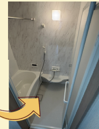
手造り浴室を、使い勝手と掃除のしやすいユニットバスに!