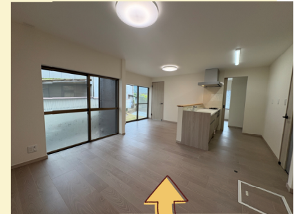
LDと居間の壁をなくして、広がり感のあるLDKになりました