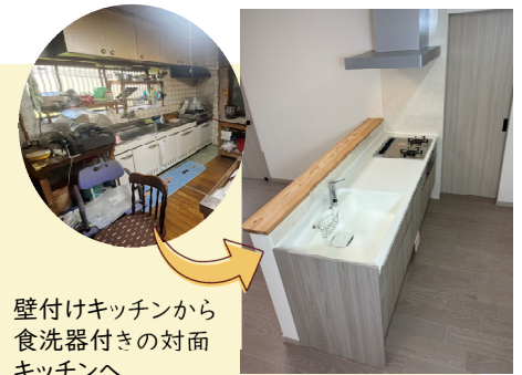
壁付けキッチンから食洗器付きの対面キッチンへ